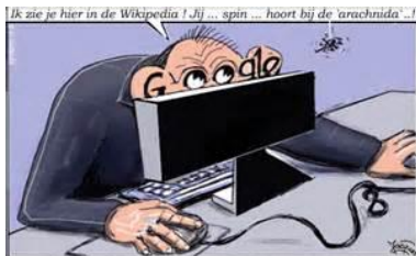
"Googelen beter dan lezen voor de hersenen van senioren"

Veiligheidsvoorlichters van KBO en PCOB weten welke maatregelen helpen om het veiliger te maken voor senioren. Zij zullen in de voorlichtingsbijeenkomsten en in het bijzonder tijdens huisbezoeken bij senioren thuis extra aandacht besteden aan de aspecten uit dit onderzoek waar senioren nog aan kunnen 'werken'. KBO en PCOB streven ernaar dat alle senioren veilig kunnen leven en wonen en daar dragen de vrijwillige KBO en PCOB-veiligheidsvoorlichters graag hun steentje aan bij.